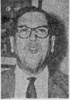
Dr. VIRIATO FIALLO

El domingo, a las cuatro y treinta de la tarde, ingresará, por el Aeropuerto de El Coco, a Costa Rica, el Dr. Viriato Fiallo, Candidato a la Presidencia de República Dominicana por el Partido Unión Cívica Nacional. El Dr. Fiallo viene especialmente invitado por el Partido