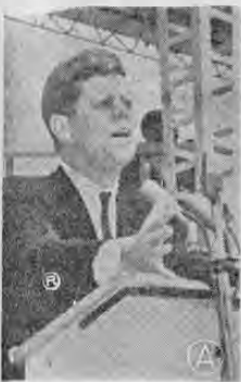
PRESIDENTE KENNEDY ...habló ayer desde la Casa Blanca...

zamiento de cohetes han sido retirados de sus emplazamientos.