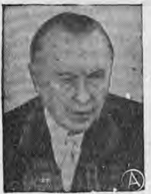
ADENAUER ...se tambalea su débil coalición...

BONN, 2. (AP)— El Partido Demócrata Libre se reunió esta noche para determinar si se debe separarse del Gobierno de coalición del Canciller Konrad Adenauer.